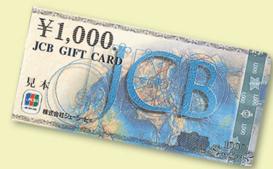
JCBギフトカード(1,000円分)