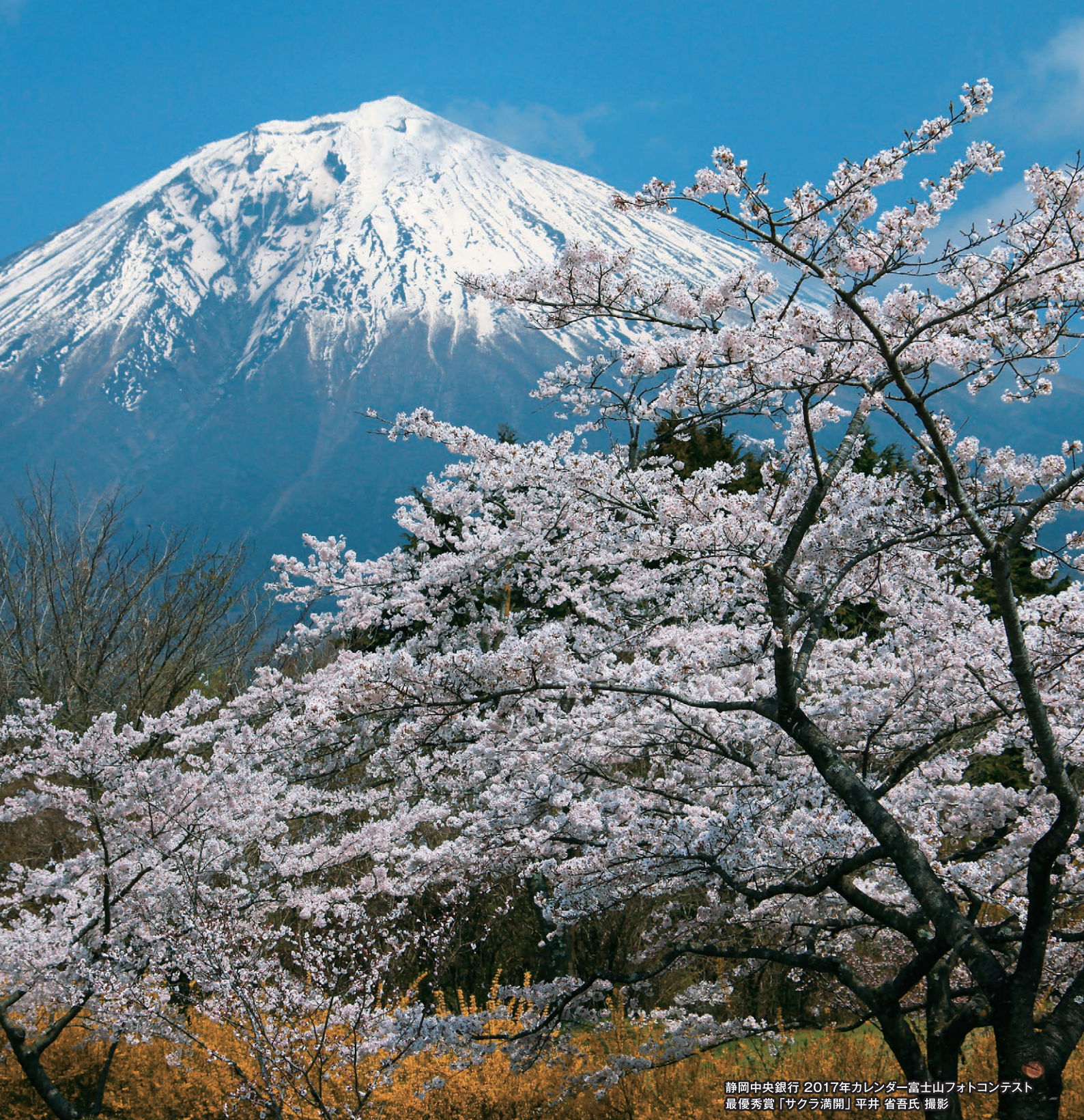
静岡中央銀行 2017年カレンダー富士山フォトコンテスト 最優秀賞「サクラ満開」