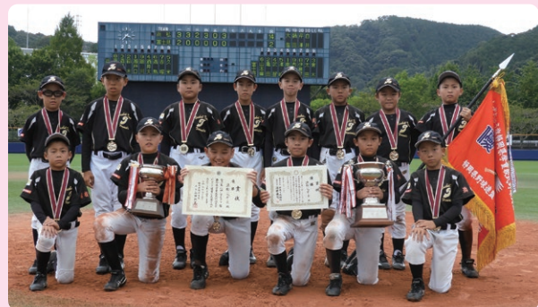
第8回大会優勝チーム 浜松ジャガーズ

また、同予選会を対象に「はつらつプレーフォトコンテスト」を実施し、入賞作品のホームページ上での公表や、当行本支店での写真展も開催しております。