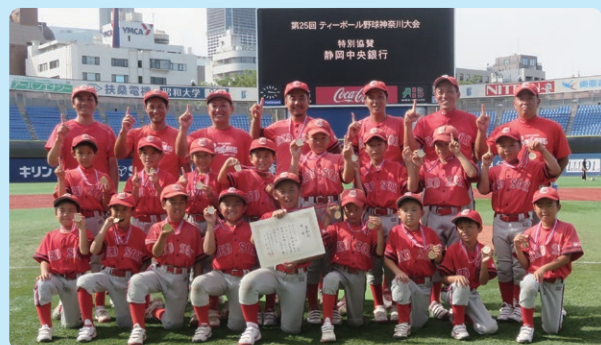
第25回大会優勝チーム 竹山レッドソックス

今後も、学童の健全な成長を応援し、「お客様・地域社会と共に発展しベストパートナーとして信頼される銀行」を目指してまいります。