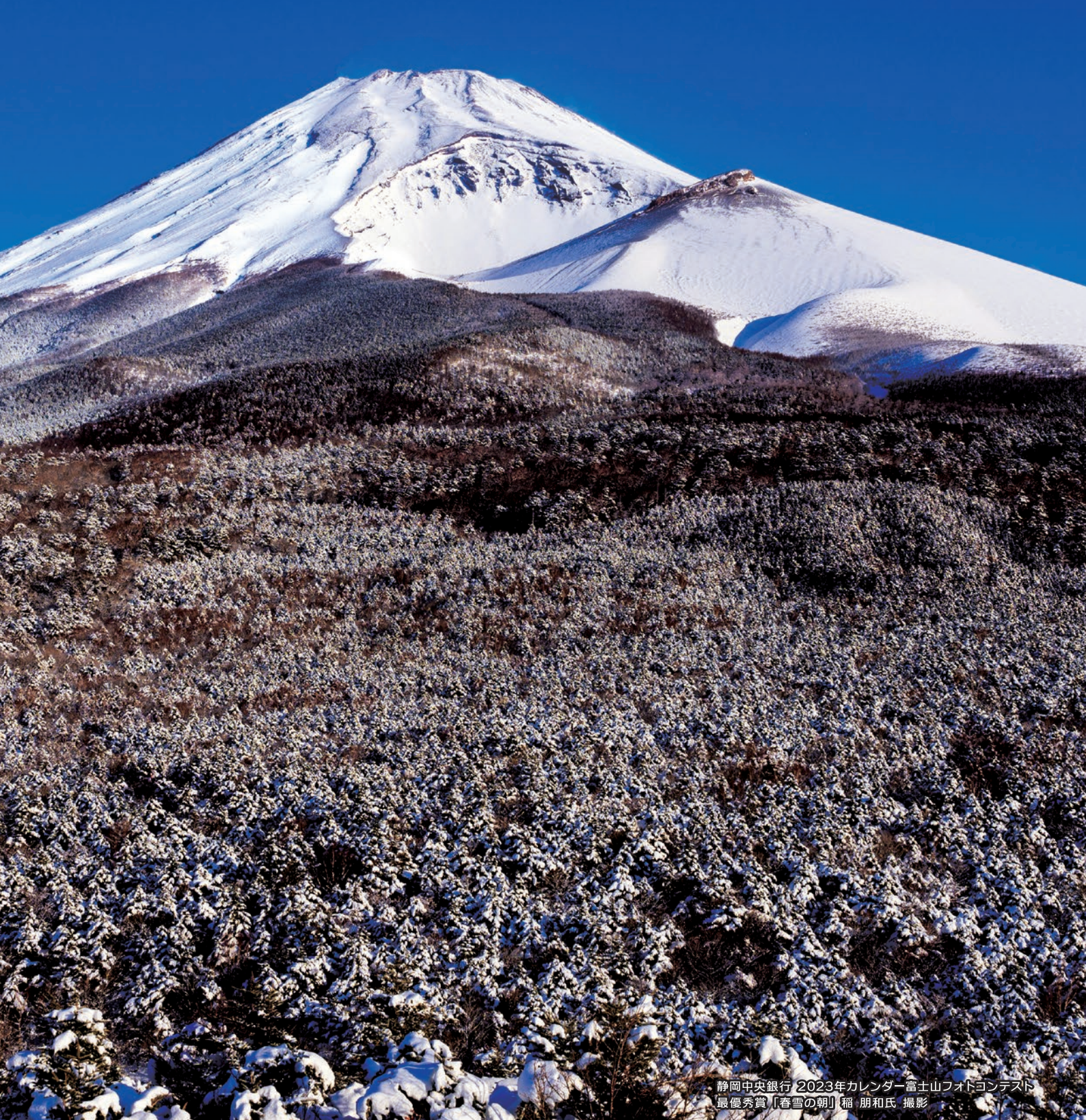
静岡中央銀行 2023年カレンダー富士山フォトコンテスト 最優秀賞「春雪の朝」