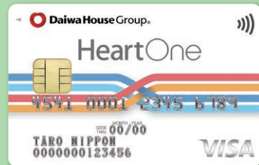
ハートワンカード クレジット機能付