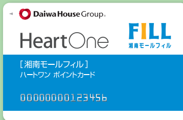
ハートワンポイントカード

お取引に応じて、 湘南モールフィル 「ハートワンカード」 にポイントが付きまます!